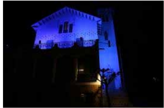
Edifici Llar Cau Blanc , una de les residències, il·luminada

- Adhesió a la campanya internacional Light it up blue . El dia 2 d'abril, per segon any consecutiu, apafac a promogut la il·luminació en blau de la façana de l'Ajuntament, l'església de la Garriga, i els edificis de la Llar Cottet, Llar Cau Blanc i cerac , per donar visibilitat a l'autisme.