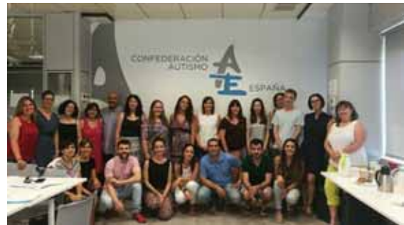
Al curs de Autismo Espa a

01-02.12.2017. Participaci  al Congreso internacional Autismo Sevilla , organitzat per la pr pia associaci  a Sevilla.