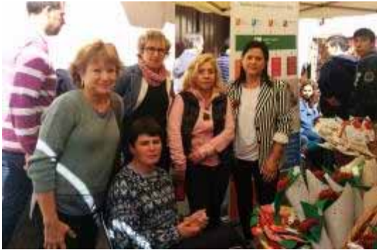
A la parada de Sant Jordi