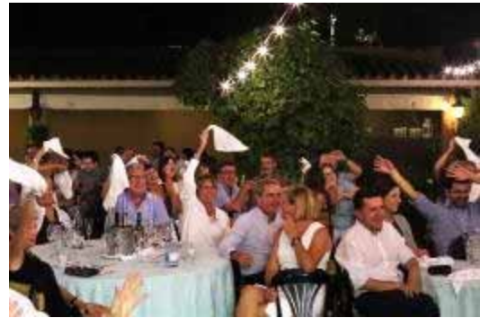
Familiars i tècnics d'autisme la garriga durant la celebració

Junts construïm projecte i caminem cap als 50!