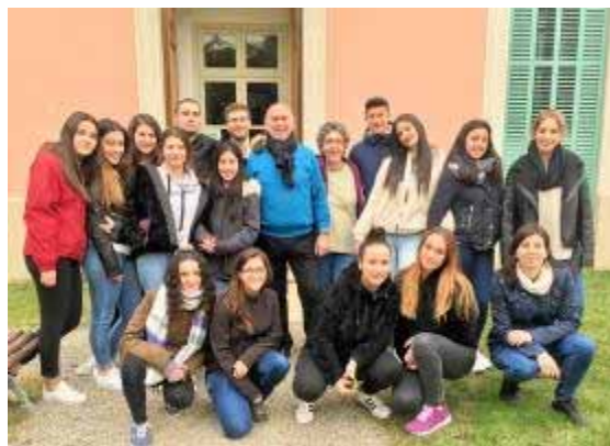
Estudiants de l'escola López Vicuña

- Visita de 15 alumnes i 2 professores de l'escola López Vicuña de Barcelona, estudiants de 2n curs del mòdul d'atenció a persones en situació de dependència.