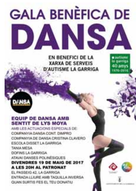
Cartell publicitari de la Gala Benèfica