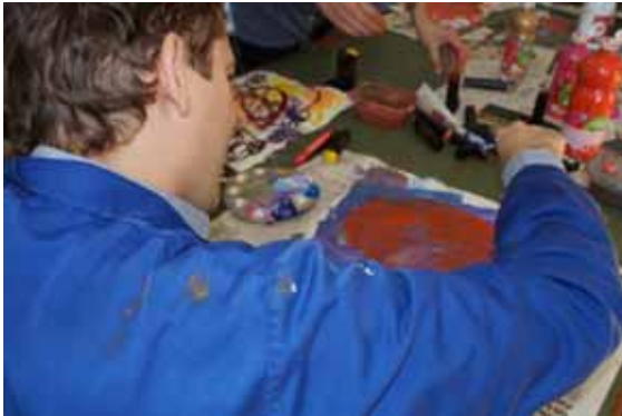
Realitzant el taller de pintura