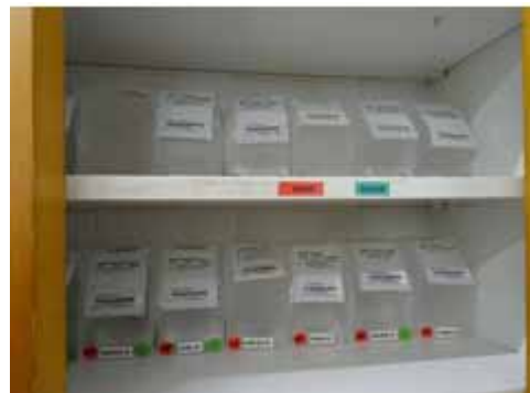
Preparació de medicació

Els armaris on hi ha la medicació estan tancats amb una clau especial que només tenen els responsables de torn, com també la medicació de reserva.