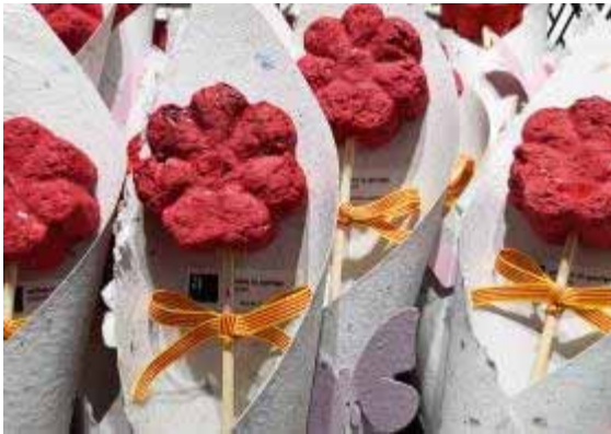
Productes que elaboren persones amb autisme

09.05.2017. Excursió per els entorns rurals de la Garriga. Programem una excursió pels camps i muntanyes propers a les cases dels usuaris.