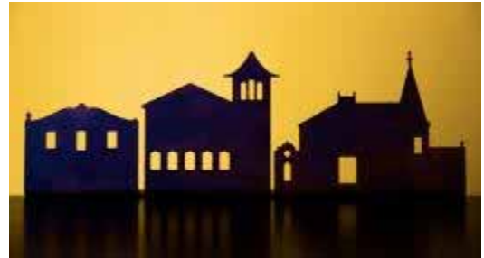
Figura commemorativa que es va entregar a tècnics

Tots els distingits amb aquest especial reconeixement van rebre un perfil de les cases d'autisme la garriga realitzat per Òxids, un taller d'artesans del ferro.