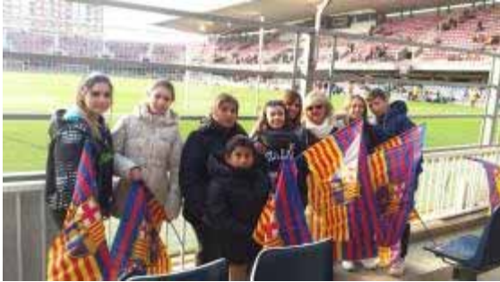
Gaudint de la sortida al Camp Nou del FCB

06.01.2017. Píscolabis. Anem al centre del poble a prendre un refresc i un aperitiu. D'entre tots els que fem durant l'any, aquest ens agrada especialment perquè els usuaris esperen l'arribada dels Reis Mags.