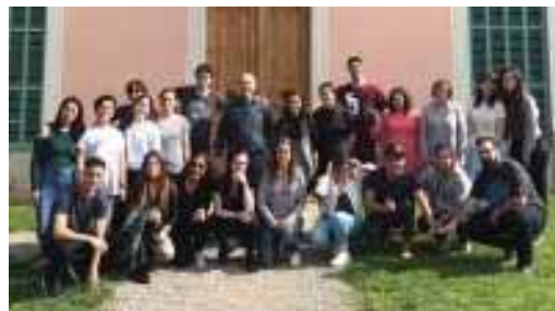
Estudiants de l'escola Ceir Arco Villaroel

- Visita de 25 alumnes i una professora del cicle formatiu de grau superior en Mediació Comunicativa, de l'escola Ceir Arco Villaroel (Barcelona).