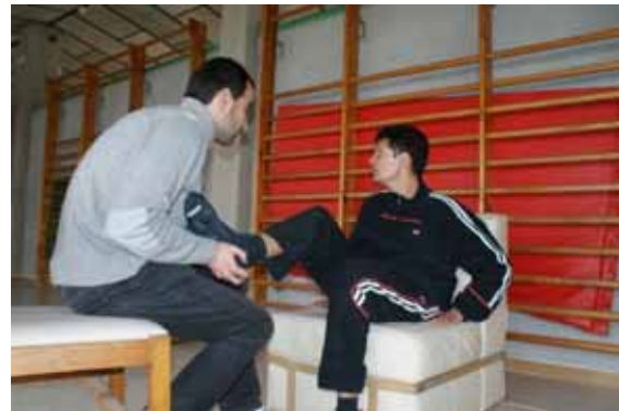
Exercicis de fisioteràpia

Tot i que el fisioterapeuta realitza la intervenció en usuaris concrets que presenten dèficit motriu, també s'està atent i molt obert a possibles lesions que puguin sorgir de qualsevol altre usuari del centre.