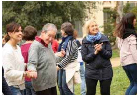
Gaudint de la festa

El concert ha estat una iniciativa d'una mare d'uns dels nois afectat pel TEA i ha comptat amb el suport de la Fundació i la Federació Autisme Catalunya .