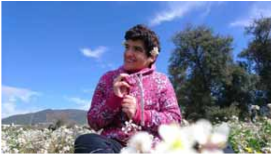
Als voltants de les llars

Consta de dues residències, la Llar Cau Blanc (1983) i la Llar Cottet (1990), situades a la Ronda del Carril, 83 i 85, de la Garriga amb una capacitat de 20 i 23 places, respectivament, en règim de concert amb el Departament de Treball, Afers Socials i Famílies.