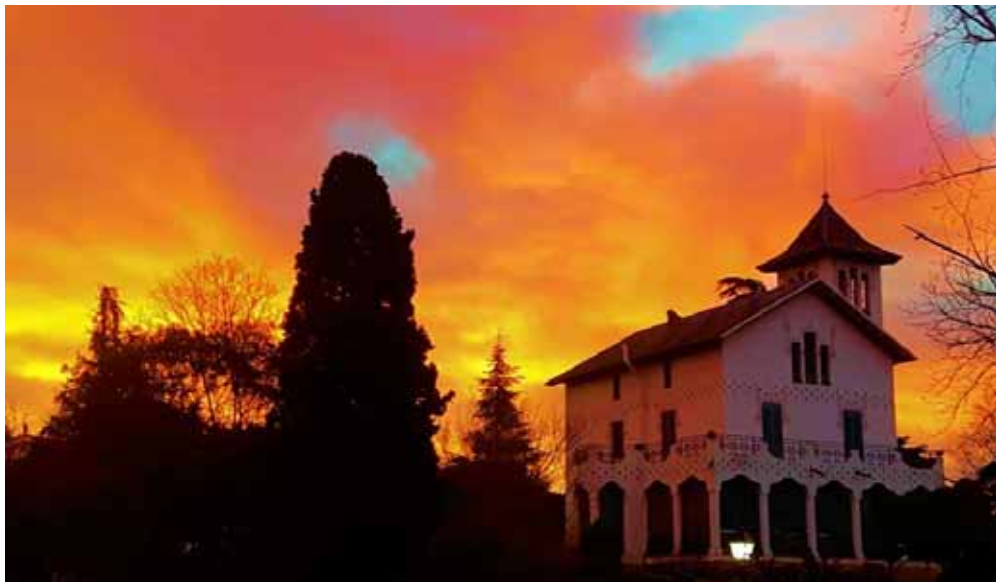
Llar Cau Blanc