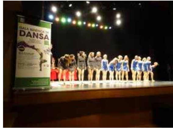
Ballarins a la Gala Benèfica

Es va organitzar un mètode de recaudació econòmica anomenat taquilla inversa , en el qual, els assistents no havien de comprar entrada per poder-hi assistir i se'ls demanava que, en la mesura que poguessin, fessin un petit donatiu a l'entitat.