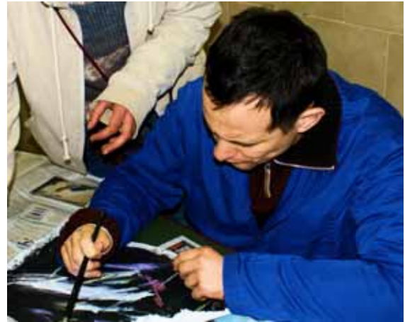
Taller de pintura

La realització del taller de pintura ha permès que els usuaris d' apafac participin en diferents exposicions i actes artístics que trobarem en els següents apartats.