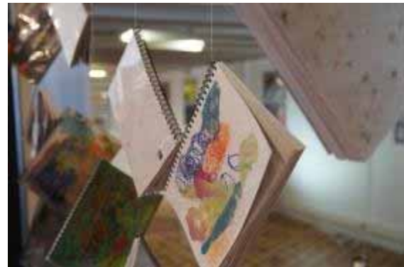
Material que confeccionen els nois i noies amb autisme d'asepac, exposats

L'exposició, ha estat organitzada per la Federació Autisme Catalunya amb motiu del Dia Mundial de Conscienciació sobre l'Autisme que es celebra cada any el 2 d'abril i que enguany té com a el lema "Trenquem junts barreres per l'autisme. Fem una societat accessible".