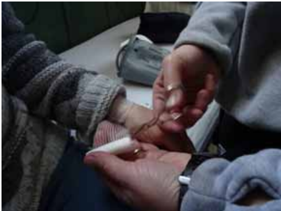
Aplicació de cures

Les lesions més comunes són les traumàtiques i les dermatològiques i tenen una durada curta (dues setmanes o menys).