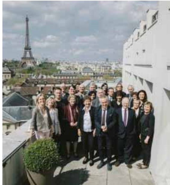
Grup de treball

La Jornada va constar de sessions de treball de matí i tarda, amb un dinar amb la ministre, la senyora Ségolène Neuville, i amb una sessió final conjunta amb representants d'associacions de pares i famílies afectades, durant la que van poder adreçar preguntes a la comissió.