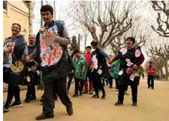
Usuaris i professionals disfressats de pintors

23.02.2017. Carnestoltes. Per celebrar el dia del rei Carnestoltes, els nois i nois de Llar Cottet i Cau Blanc enguany s'han disfressat d'artistes pintors. Després d'una passejada pel poble, ho han celebrat amb una festa i un berenar.