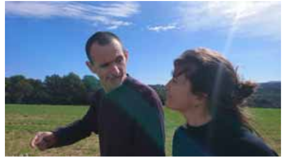
Membres d' apafac

Les activitats s'adeqüen a les necessitats individuals de cadascun dels usuaris.