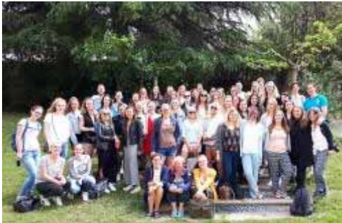
Alumnes de l'Universitat Fontys

- Visita de 50 alumnes de pedagogia, amb 4 professors. Universitat Fontys (Eindhoven).