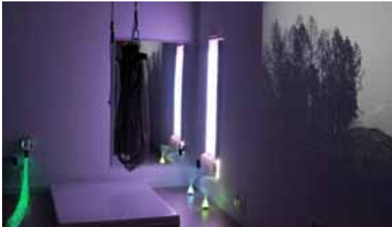
La sala d'Estimulació Sensorial

L'estimulació sensorial és una eina molt pràctica i eficaç en Teràpia Ocupacional i, especialment, en la cura de persones amb discapacitat i grans amb deteriorament cognitiu, perquè els ajuda a entrenar la ment i també la psicomotricitat, a través d'elements visuals, auditius, tàctils, olfactius i gustatius.