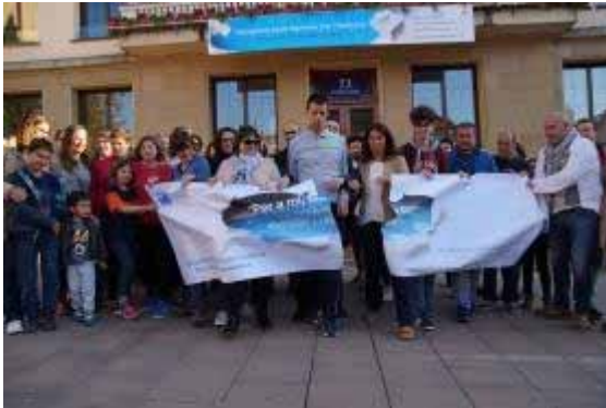
Acte a la plaça de l'Església, davant l'Ajuntament de la Garriga

garriga , professors i alumnes d'escoles i instituts i grans i petits de la població.