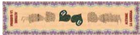
La catifa de Corpus

15.06.2017. Corpus. Com ja és habitual vam participar en la festa de Corpus, tan popular a la Garriga. La catifa d'aquest any ha tornat a ser més clàssica, celebrant els 40 anys de la xarxa de serveis. Professionals i familiars van participar en la seva elaboració i quan van acabar van esmorzar tots junts.