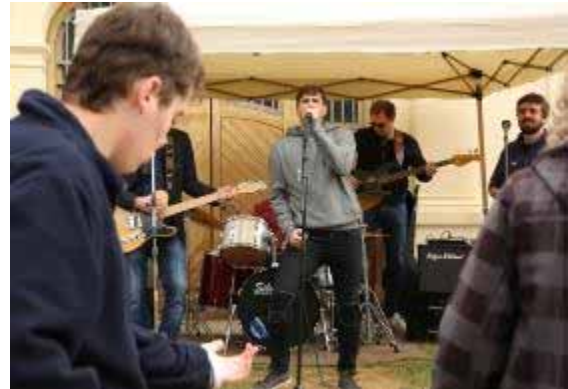
Ballant al ritme dels Charlies

aquesta ocasió i dedicat a totes les persones amb autisme.