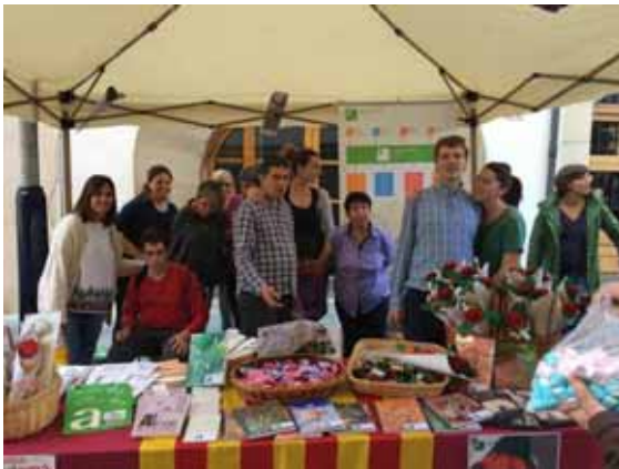
A la parada de Sant Jordi

23.04.2017. Sant Jordi. Com ja és tradició des de fa uns anys, per Sant Jordi, la Fundació dóna suport a les entitats dedicades a l'autisme per tal que puguin mostrar els treballs fets als tallers. Aquest any s'ha organitzat una paradeta al centre del poble de la Garriga i una altra al barri de Gràcia de Barcelona.