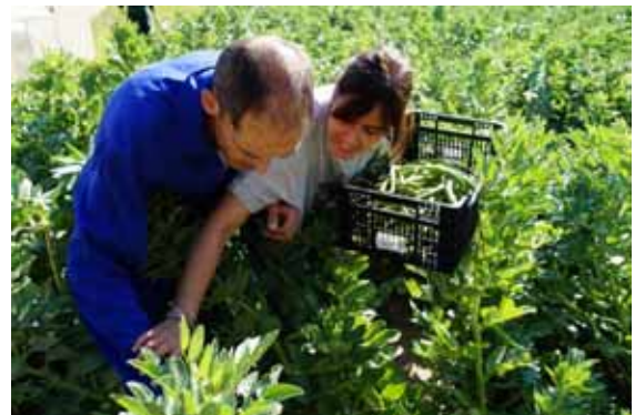
Realitzant el taller d'horta

mentals és la integració sociolaboral, ja que contribueix a incrementar la seva autoestima com a fruit del reconeixement social que suposa el fet de realitzar un treball productiu. En el cas de les persones afectades d'autisme de baix funcionament, el repte és molt important, ja que a les dificultats derivades de l'important dèficit cognitiu, cal afegir-hi les provinents de les severes alteracions de conducta. Per aquest motiu, la inserció sociolaboral d'aquest subgrup no es pot realitzar en entorns de treball ordinari, sinó que és necessària l'existència de centres de teràpia ocupacionals (com TERLAB) amb tallers laborals adaptats a les característiques dels usuaris.