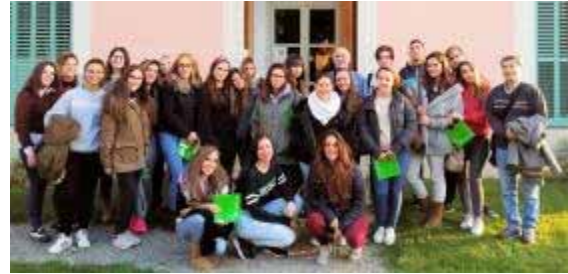
Alumnes de l'Institut Pla Marcell

d'atenció a persones en situació de dependència.