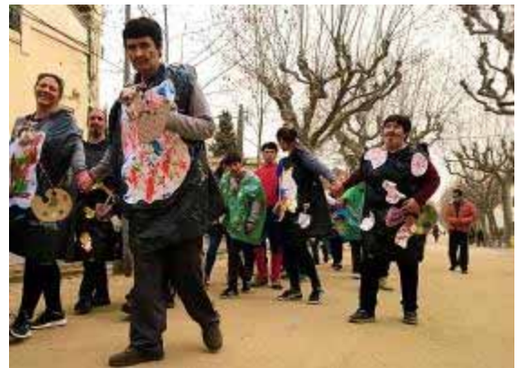
Usuaris i professionals disfressats de pintors

23.02.2017. Carnestoltes. Per celebrar el dia del rei Carnestoltes, els nois i nois de Llar Cottet i Cau Blanc enguany s'han disfressat d'artistes pintors. Després d'una passejada pel poble, ho han celebrat amb una festa i un berenar.