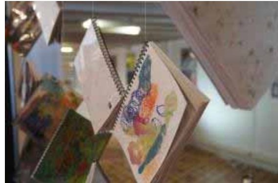
Material que confeccionen els nois i noies amb autisme d'asepac, exposats

L'exposició, ha estat organitzada per la Federació Autisme Catalunya amb motiu del Dia Mundial de Conscienciació sobre l'Autisme que es celebra cada any el 2 d'abril i que enguany té com a el lema "Trenquem junts barreres per l'autisme. Fem una societat accessible".