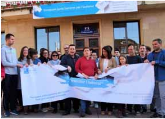
Acte a la plaça de l'Església, davant l'Ajuntament de la Garriga

01.04.2017. Concert de "Los Amigos de Charlie" i pica-pica de celebració del Dia Mundial de Conscienciació de l'Autisme.