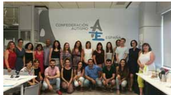
Al curs de Autismo Espa a

01-02.12.2017. Participaci  al Congreso internacional Austismo Sevilla , organitzat per la pr pia associaci  a Sevilla.