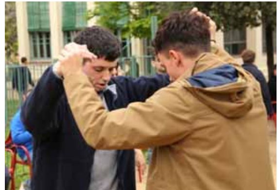
Gaudint de la festa

El concert ha estat una iniciativa d'una mare d'uns dels nois afectat pel TEA i ha comptat amb el suport de la Fundació Congost Autisme i la Federació Autisme Catalunya .