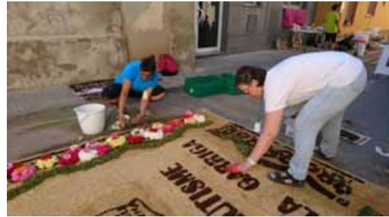
Confeccionant la catifa de Corpus

15.06.2017. Corpus. Com ja és habitual vam participar en la festa de Corpus, tan popular a la Garriga. La catifa d'aquest any ha tornat a ser més clàssica, celebrant els 40 anys de la xarxa de serveis. Professionals i familiars van participar en la seva elaboració i quan van acabar van esmorzar tots junts.