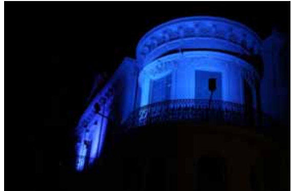
Edifici Llar Cottet il·luminat

- Acte "Trenquem junts barreres per l'autisme". Simbòlicament s'ha trencat una barrera per a les persones amb Trastorn de l'Espectre Autista (TEA) : "Per a mi una barrera és la no inclusió social, escolar i laboral". A l'acte, han participat persones amb TEA , tot el consistori de la Garriga encapçalat per la seva alcaldessa, professionals de la xarxa de Serveis autisme la garriga , professors i alumnes d'escoles i instituts i grans i petits de la població.