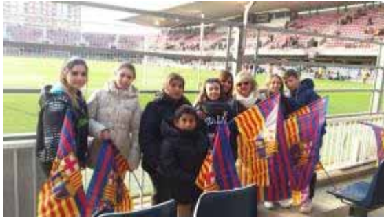
Gaudint de la sortida al Camp Nou del FCB

03.01.2017. Sortida al Camp Nou del FCBarcelona. La Fundació organitza la visita d'un grup de nois i noies amb autisme, les seves famílies i professionals, al Camp Nou, convidats per la Fundació Futbol Club Barcelona. Allà, van poder gaudir de veure un entrenament ordinari del primer equip del Barça.