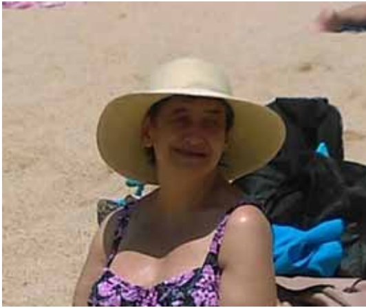
Usuaris durant l'excursió a la platja

23.06.2017. Sant Joan. Com cada any s'ha celebrat la revetlla de Sant Joan amb bengales i petards als jardins de Llar Cottet.