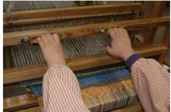
Taller de teixits