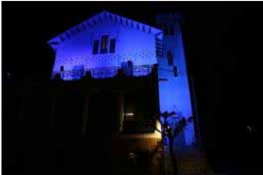
Edifici Llar Cau Blanc, una de les residències, il·luminada

- Adhesió a la campanya internacional Light it up blue . El dia 2 d'abril, per segon any consecutiu, la Federació Autisme Catalunya ha promogut la il·luminació en blau de la façana de l'Ajuntament, l'església de la Garriga, i els edificis de les entitats que la conformen, per donar visibilitat a l'autisme.