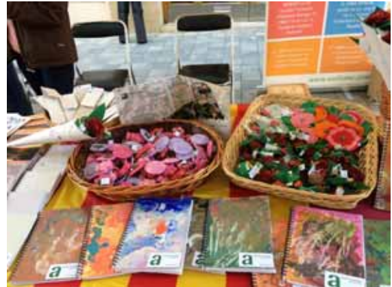
Productes que elaboren persones amb autisme

09.05.2017. Excursió per els entorns rurals de la Garriga. Programem una excursió pels camps i muntanyes propers a les cases dels usuaris.