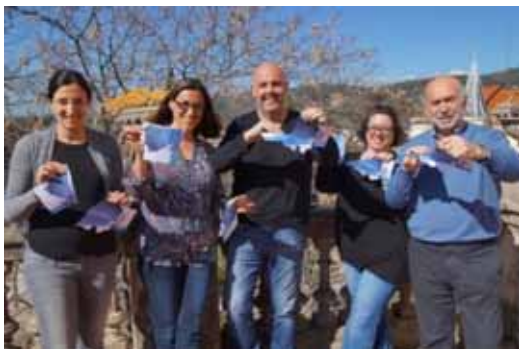
Amb el lema "Trenquem junts barreres per l'autisme. Fem una societat accessible"

Enguany, les activitats han estat organitzades per la Federació Autisme Catalunya amb col·laboració de la Fundació Congost Autisme.