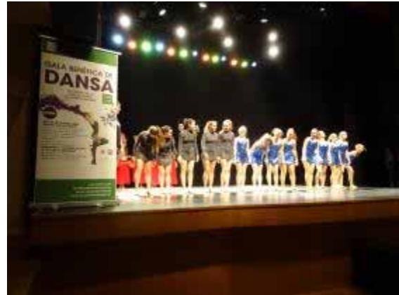
Ballarins a la Gala Benèfica

Es va organitzar un mètode de recaudació econòmica anomenat taquilla inversa , en el qual, els assistents no havien de comprar entrada per poder-hi assistir i se'ls demanava que, en la mesura que poguessin, fessin un petit donatiu a l'entitat.