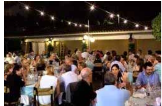
Durant el sopar

Durant el curs 2016-2017 vam celebrar amb il·lusió i projecte de futur 40 anys i ho vam culminar amb aquesta festa dedicada als professionals. Una nit compartida amb els de casa, 160 persones, familiars i professionals, que juntament amb els nois i noies protagonistes del projecte conformem autisme la garriga .