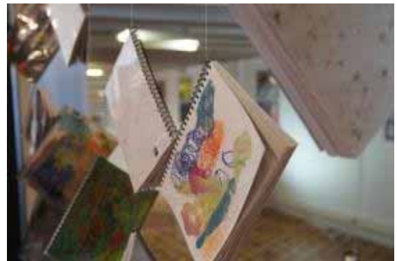
Material que confeccionen nois i noies amb autisme

L'exposició, es va fer a la sala principal de la Fundació Enric Miralles, que molt amablement la va cedir.