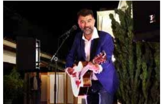
En Pep Plaza

Pep Plaza, conductor de la festa, ens oferí una magnífica vetllada. Ens va fer trencar de riure a tots amb el seu llarg repertori d'imitació de personatges coneguts com Ferran Adrià, Pep Guardiola, Josep Ma. Mainat, Eugenio, Quim Monzó, Jordi Pujol, Mariano Rajoy. I també amb les seves imitacions de cantants com Sabina, Joan Manuel Serrat i un llarg etcètera.