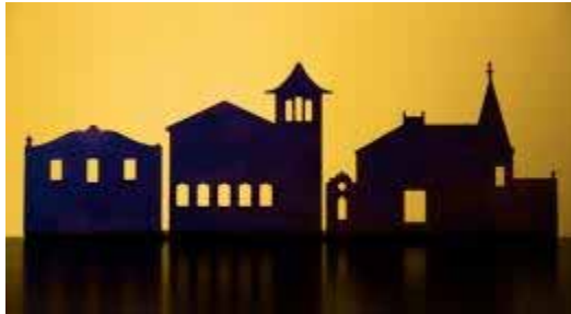
Figura commemorativa que es va entregar a tècnics

Pep Plaza, conductor de la festa, ens oferí una magnífica vetllada. Ens va fer trencar de riure a tots amb el seu llarg repertori d'imitació de personatges coneguts com Ferran Adrià, Pep Guardiola, Josep Ma. Mainat, Eugenio, Quim Monzó, Jordi Pujol, Mariano Rajoy. I també amb les seves imitacions de cantants com Sabina, Joan Manuel Serrat i un llarg etcètera.