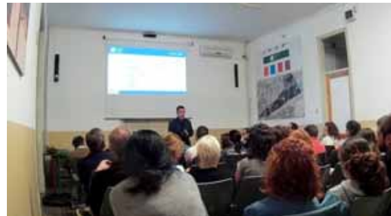
Durant el curs adreçat a famílies

Enguany, van participar-hi 45 familiars de persones amb TEA.