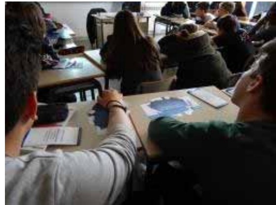
A un dels instituts de la Garriga