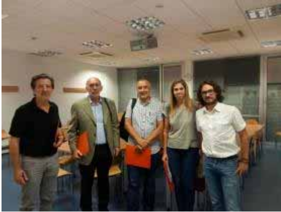
Durant les Jornades Crítics de Psicologia

L'objectiu d'aquestes Jornades, que varen reunir professionals de tot l'estat espanyol, era discutir tota una sèrie de temes controvertits en l'àmbit de la pràctica professional: eficàcia de la psicologia, criteris de qualitat de la investigació científica, la divulgació de la psicologia, ètica i psicologia, etc.