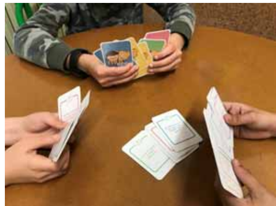
Treballant les emocions

Les competències emocionals ens permeten dirigir i regular els processos emocionals en un mateix i als altres . L'autoconeixement emocional representa la base per a assolir habilitats que s'utilitzen en les accions pròpies i en les interaccions socials. Per tant, educar les emocions és la línia base en l'entrenament d'habilitats socials.