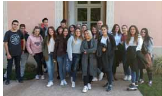
Estudiants de l'escola Ceir Arco Villarroel

04.05.17. Visita de 25 alumnes i una professora del cicle formatiu de grau superior en Mediació Comunicativa, de l'escola Ceir Arco Villarroel (Barcelona).