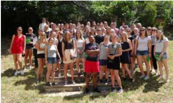
Alumnes de la Universitat de Fontys

06.06.2017. Visita de 50 alumnes de pedagogia, amb 4 professors de la Universitat Fontys (Eindhoven).