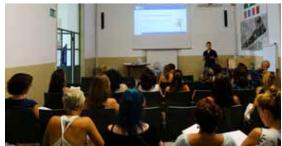
Durant el curs que vam oferir al juliol

A l'apartat "Activitats docents 2017" d'aquest document s'especifica el contingut del curs.