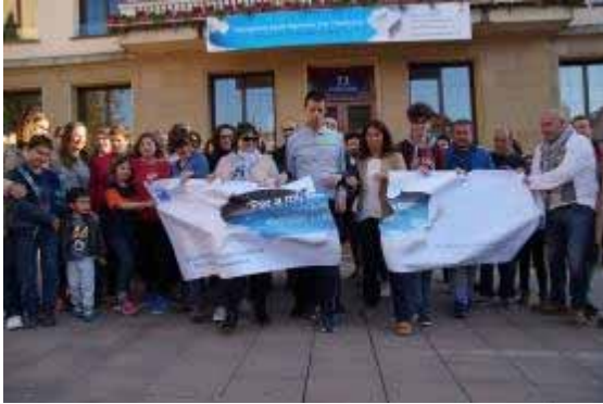
Acte a la plaça de l'Església, davant l'Ajuntament de la Garriga

31.03.2017. Exposició a la Fundació Enric Miralles. La Fundació congost autisme conjuntament amb la Federació Autisme Catalunya, va organitzar una exposició sobre autisme amb obres de pintura realitzades per persones greument afectades per aquest trastorn del desenvolupament.