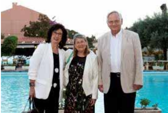
Familiars al sopar

GRÀCIES, FELICITATS, RECONeixEMENT I CELEBRACIÓ foren les paraules clau de la vetllada que comptà amb la inestimable col·laboració de l'humorista i imitador de molts personatges Pep Plaza, que actualment col·labora a programes de TV3 com Polònia o Crakòvia.