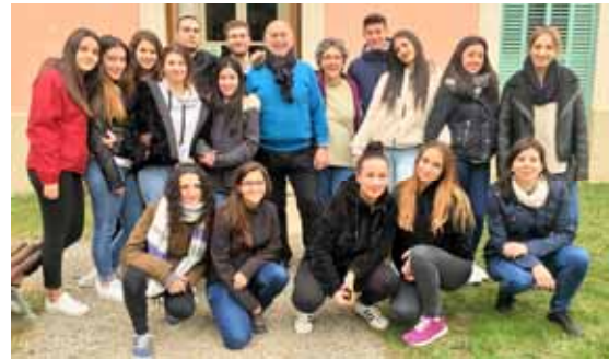
Alumnes de l'Institut Pla Marcell

Durant 2017. Visita de dues professionals de la Fundació Estela de Tarragona: la directora de la Llar i la directora tècnica del centre ocupacional.