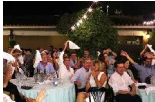
Familiars i tècnics d'autisme la garriga durant la celebració

La seva col·laboració és clau en la creació dels espais on es desenvolupa la xarxa de serveis. Unes magnífiques torres del modernisme d'estiueig es converteixen en les llars de persones greument afectades per l'autisme i s'envolten dels serveis necessaris per donar una resposta integral a les seves necessitats.