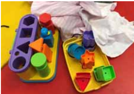
Durant l'aplicació de proves

disruptives, ja que poden impedir que l'entrevista es desenvolupi adequadament. En aquests casos, els professionals responsables de l'observació conductual inicien paral·lelament la seva tasca amb el pacient.