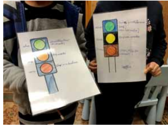
Aprent a regular les nostres emocions

dificultats de generalització que tenen (teoria de la coherència central, Uta Frith).