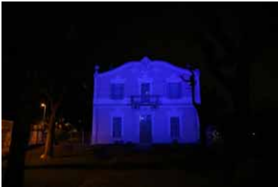
L'edifici de cerac, il·luminat