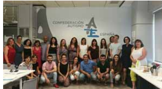
Al curs de Autismo España

15-16.06.2017. Assistència al curs "Prevención, identificación e intervención en casos de acoso a las personas con TEA". Aquest curs va ser organitzat per la Confederación Autismo España a Madrid.