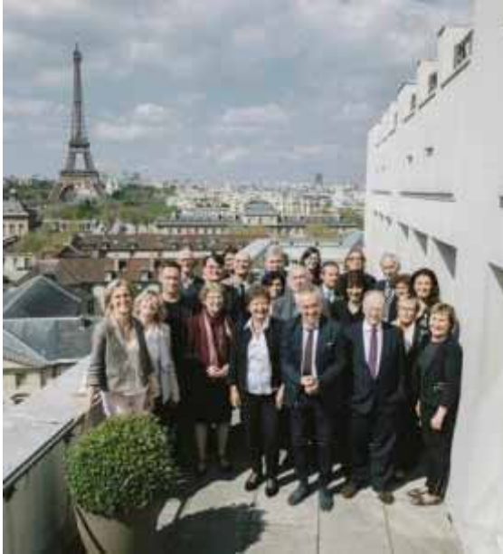
Grup de treball

Amb posterioritat a aquesta reunió, la comissió s'organitzà en subgrups per temàtiques, amb l'objectiu de continuar el treball mitjançant vídeo-conferències.