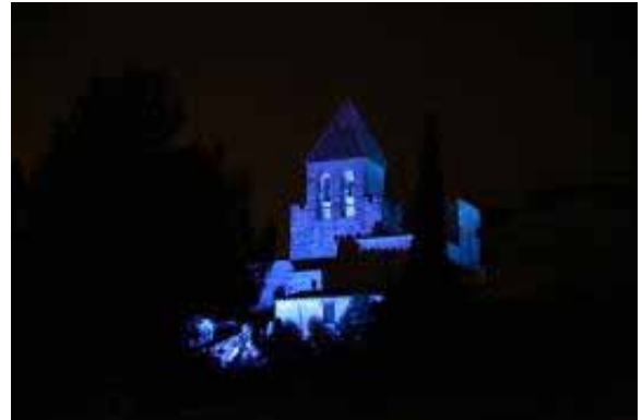
El Campanar de la Garriga, il·luminat de blau