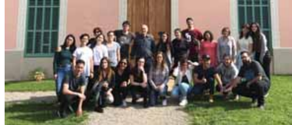
Estudiants de l'escola López Vicuña

24.02.2017. Visita de 15 alumnes i 2 professores de l'escola López Vicuña de Barcelona, del 2n curs del mòdul d'atenció a persones en situació de dependència.