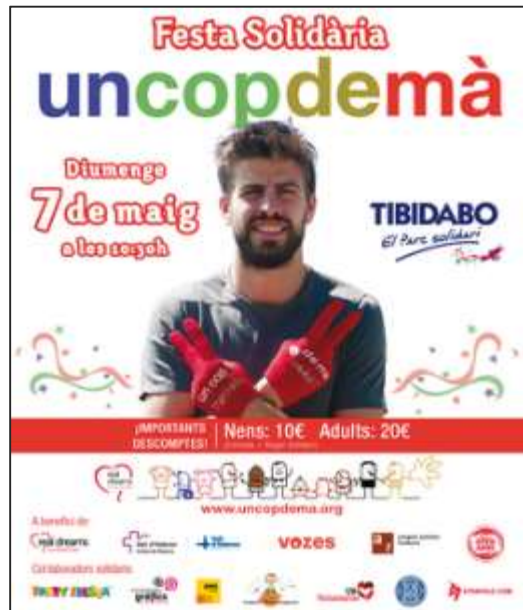
Cartell de difusi3n

La Fundaci3n va dur a terme un taller de pintar samarretes blaves amb el lema "un cop de mà per l'autisme". En aquest taller es van utilitzar pintures " Playcolor one textil " que el Grupo Dunsa va donar desinteressadament a la Fundaci3n per poder realitzar aquest taller i acolorir m3s centenars de samarretes blaves. El taller fou un gran èxit ja que durant tota la diada, els voluntaris de la Fundaci3n congost autisme no van parar de fer tallers amb les famílies que omplien l'stand a vessar.