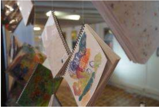
Material que confeccionen nois i noies amb autisme

A l'exposició, es van poder veure diverses obres de pintura realitzades per persones afectades pel Trastorn de l'Espectre Autista (TEA), fotografies dels autors amb persones de reconegut prestigi dins el seu àmbit i també altres objectes artístics realitzat amb paper reciclat.