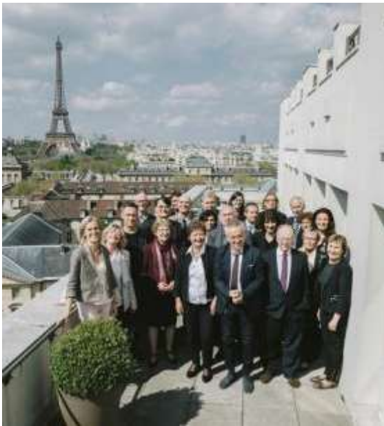
Grup de treball

La Jornada va constar de sessions de treball de matí i tarda, amb un dinar amb la ministra, la senyora Ségolène Neuville, i amb una sessió final conjunta amb representants d'associacions de pares i famílies afectades, durant la que van poder adreçar preguntes a la comissió.