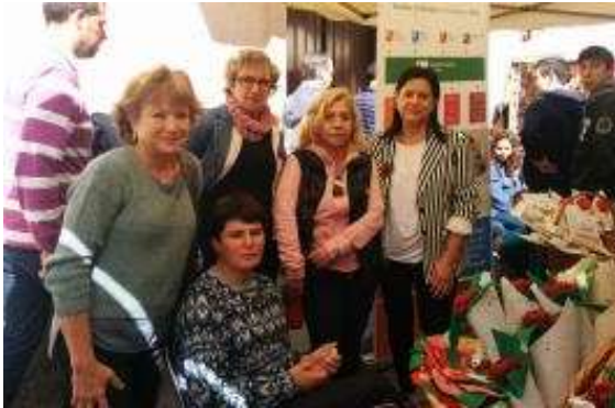
A la parada de Sant Jordi

23.04.2017. Sant Jordi. Com ja és tradició des de fa uns anys, per Sant Jordi, la Fundació dóna suport a les entitats dedicades a l'autisme per tal que puguin mostrar els treballs fets als tallers. Aquest any s'ha organitzat una paradeta al centre del poble de la Garriga i una altra al barri de Gràcia de Barcelona.