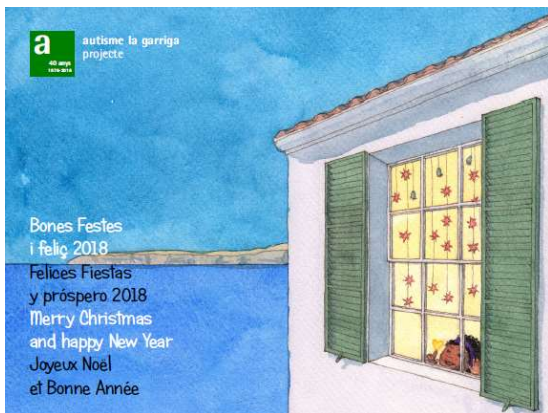
Postal de Nadal, imatge de Roser Armengol

La felicitació de Nadal que enguany la Fundació va enviar als amics i col·laboradors ha estat feta amb una il·lustració cedida gratuïtament per la il·lustradora Roser Armengol, amb la qual s'han fet postals molt boniques en paper reciclat fet per persones greument afectades per autisme.