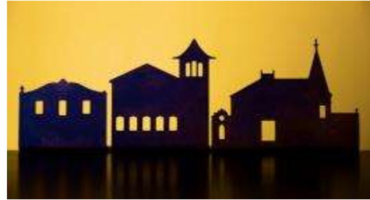
Figura commemorativa que es va entregar

cases d'autisme la garriga realitzat per Òxids, un taller d'artesans del ferro.