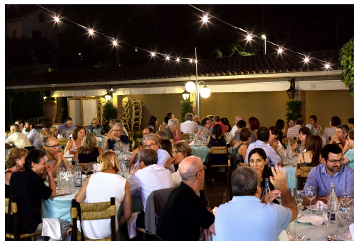
Assistents al sopar

Una nit compartida amb els de casa, 160 persones, familiars i professionals de nois i noies greument afectats pel TEA.