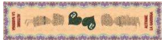
La catifa de Corpus

15.06.2017. Corpus. Com ja és habitual vam participar en la festa de Corpus, tan popular a la Garriga. La catifa d'aquest any ha tornat a ser més clàssica, celebrant els 40 anys de la xarxa de serveis. Professionals i familiars van participar en la seva elaboració i quan van acabar van esmorzar tots junts.