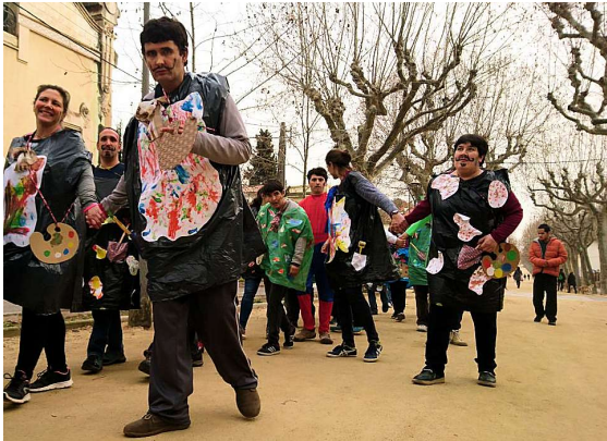
Usuaris i professionals disfressats de pintors

23.02.2017. Carnestoltes. Per celebrar el dia del rei Carnestoltes, nois i nois greument afectats pel TEA enguany s'han disfressat d'artistes pintors. Després d'una passejada pel poble, ho han celebrat amb una festa i un berenar.