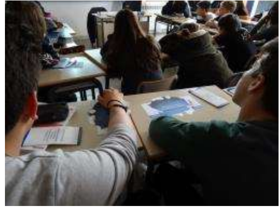
A un dels instituts de la Garriga