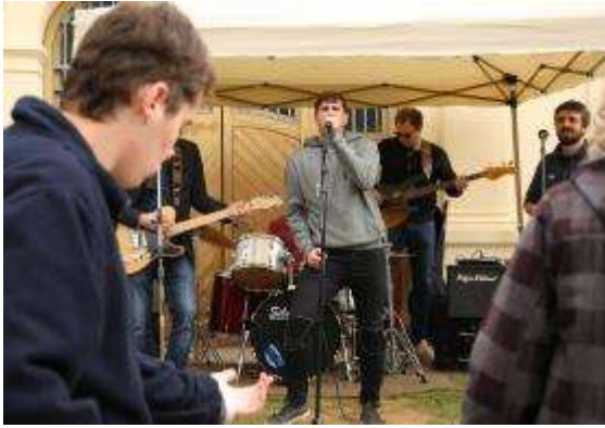
Ballant al ritme dels Charlies

El concert ha estat una iniciativa d'una mare d'uns dels nois afectat pel TEA i ha comptat amb el suport de la Fundació.