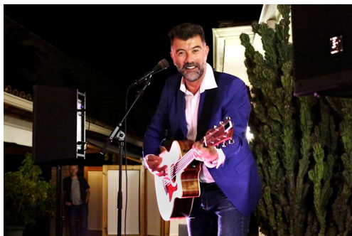
En Pep Plaza

Gràcies, Felicitats, Reconeixement, Celebració: aquestes foren les paraules clau de la vetllada que comptà amb la inestimable col·laboració de l'humorista i imitador de molts personatges Pep Plaza, que actualment col·labora a programes de TV3 com Polònia o Crakòvia.