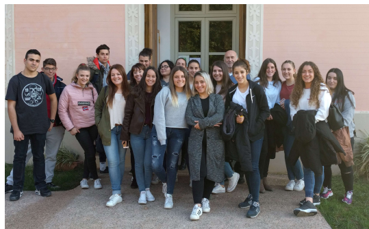
Alumnes de l'Institut Pla Marcell

22 i 29.11.2017. Visita de 25 alumnes i 2 professores de l'Institut Pla Marcell de Cardedeu, del 2n curs del cicle formatiu de grau mig d'atenció a persones en situació de dependència.