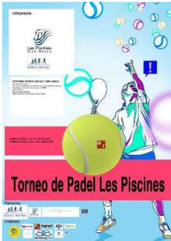
Cartell de difusió

Els organitzadors del torneig van destinar tota la recaptació a la fundació congost autisme .