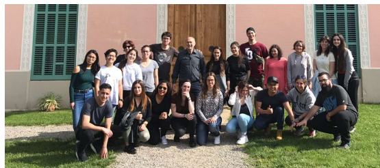
Estudiants de l'escola Ceir Arco Villarroel

04.05.17. Visita de 25 alumnes i una professora del cicle formatiu de grau superior en Mediació Comunicativa, de l'escola Ceir Arco Villarroel (Barcelona).