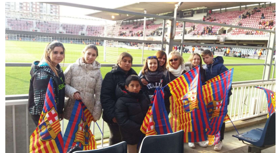
Gaudint de la sortida al Camp Nou del FCB

03.01.2017. Sortida al Camp Nou del FC. La Fundació organitza la visita d'un grup de nois i noies amb autisme, les seves famílies i professionals, al Camp Nou, convidats per la Fundació Futbol Club Barcelona. Allà, van poder gaudir de veure un entrenament ordinari del primer equip del Barça.