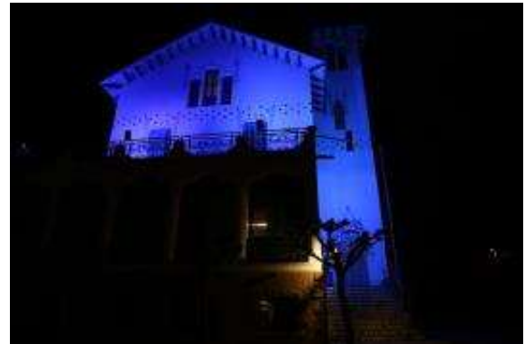
Edifici Llar Cau Blanc, il·luminat