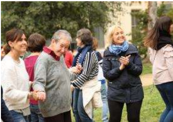
Gaudint de la festa

El concert ha estat una iniciativa d'una mare d'uns dels nois afectat pel TEA i ha comptat amb el suport de la Fundació.