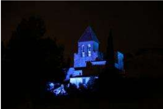
El Campanar de la Garriga, il·luminat de blau