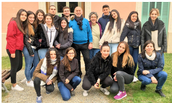
Estudiants de l'escola López Vicuña

24.02.2017. Visita de 15 alumnes i 2 professores de l'escola López Vicuña de Barcelona, del 2n curs del mòdul d'atenció a persones en situació de dependència.