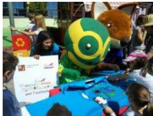
A la Festa Solidària Uncopdemà