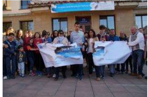
Acte a la plaça de l’Església, davant l’Ajuntament de la Garriga

01.04.2016. Concert de “Los Amigos de Charlie” i pica-pica de celebració del Dia Mundial de Conscienciació de l’Autisme.