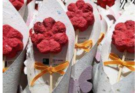
Productes que elaboren persones amb autisme

15.06.2017. Corpus. Com ja és habitual vam participar en la festa de Corpus, tan popular a la Garriga. La catifa d'aquest any ha tornat a ser més clàssica, celebrant els 40 anys de la xarxa de serveis. Professionals i familiars van participar en la seva elaboració i quan van acabar van esmorzar tots junts.